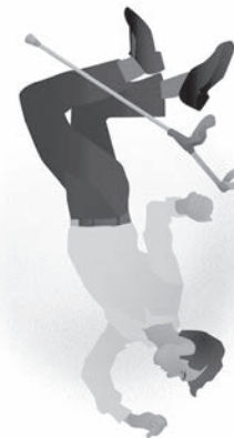
Tegnet af: Mikkel Henssel

Er man indlagt over flere dage, er der generelt mere tid til at få udskrivelsen planlagt, så det nære sundhedsvæsen i kommunen kan være forberedt på at yde den sundhedsfaglige bistand, og få iværksat hjemmehjælp, om det er det, der er behov for.