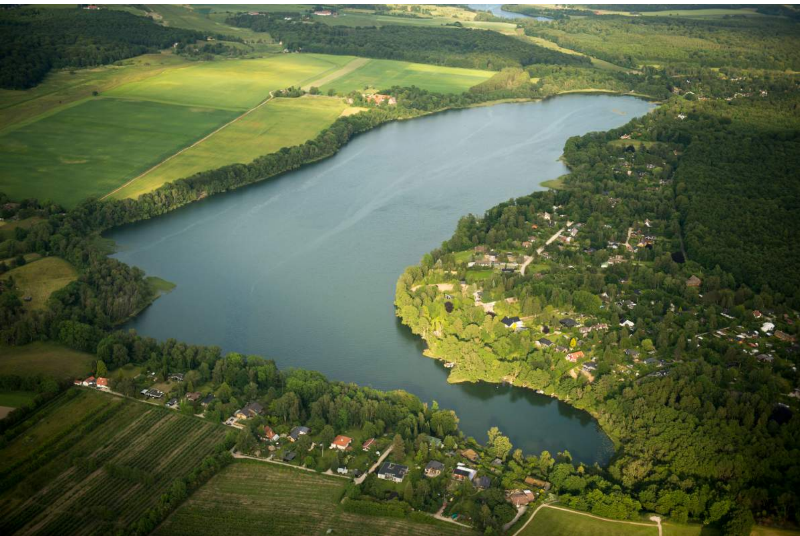
Foto: Buresø med Bastrup Sø i baggrunden (set fra vest mod øst), juni 2012.

Denne afgørelse, i form af en screening, meddeles samtidig med offentliggørelse af udkast til handleplanen.