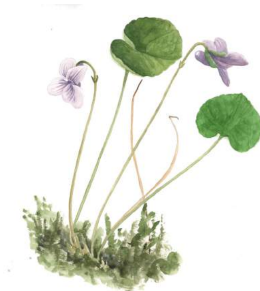
Tørveviol. Rødlistet planteart der vokser i Natura 2000-området.