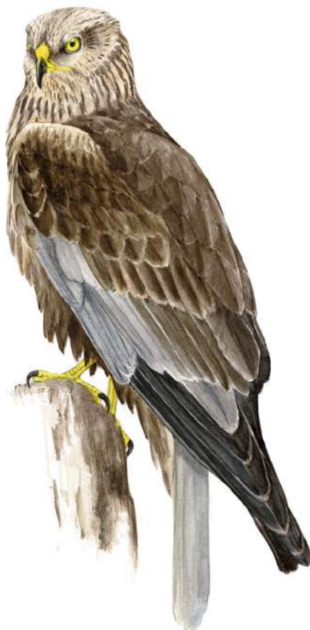
Rørhøg (han). Udpegnings art for Natura 2000-området.